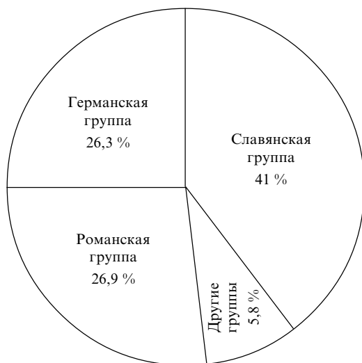
Рис. 1. Доля различных групп в индоевропейской языковой семье [19]

произошедшее, по-видимому, от двух различных антропологических видов. Украинский ученый XIX в. И. Сикорский [30], например, был убежден, что в Европе в наиболее отдаленные времена существовали четыре подрасы , развившиеся от одного из первичных делений. Путем дальнейшего долгого смешения возникли современные народы Европы, в составе каждого из которых наблюдается в различных пропорциях четыре основных корня: короткоголовые высокого и низкого роста (эти группы, кроме того, различаются цветом волос, глаз и кожи). Данные различия, обнаруживающиеся в таком раннем периоде истории человечества, объясняются, скорее всего, несколькими последовательными волнами переселения во время относительно теплой межледниковой эпохи. Известно, например, что на территории Европы 30–40 тыс. лет тому назад неандертальцев сменили кроманьонцы, а затем появились средиземноморцы и индоевропейцы.