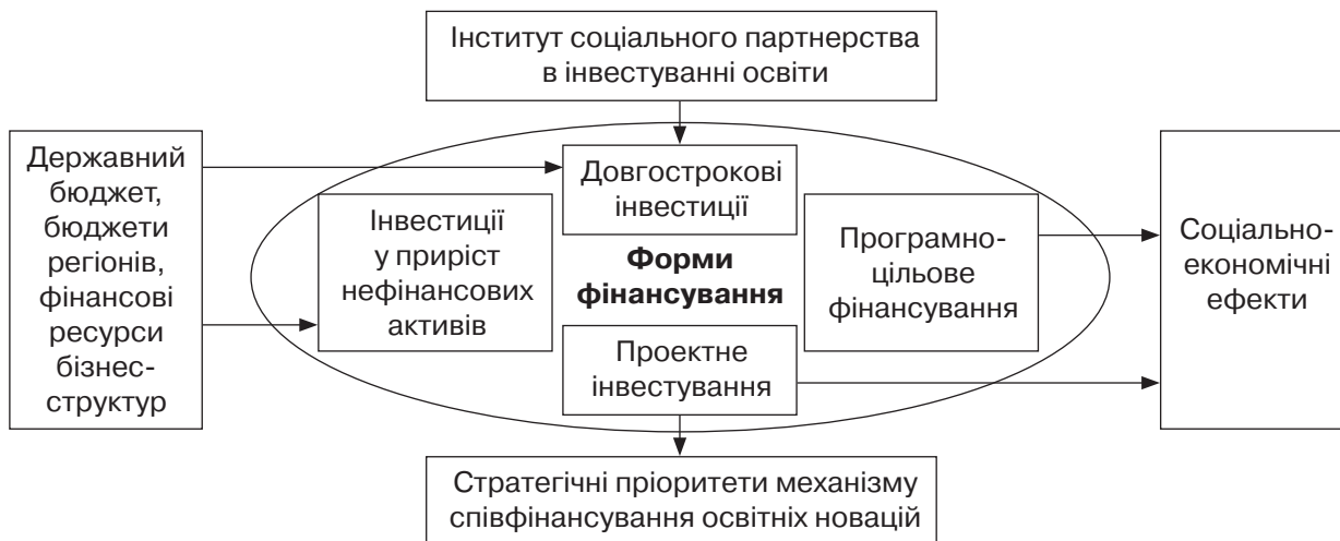
Рис. 1. Система співфінансування освітніх новацій

Підвищення ефективності співфінансування освітньої діяльності неможливе без розвитку інституту соціального партнерства (рис.1).