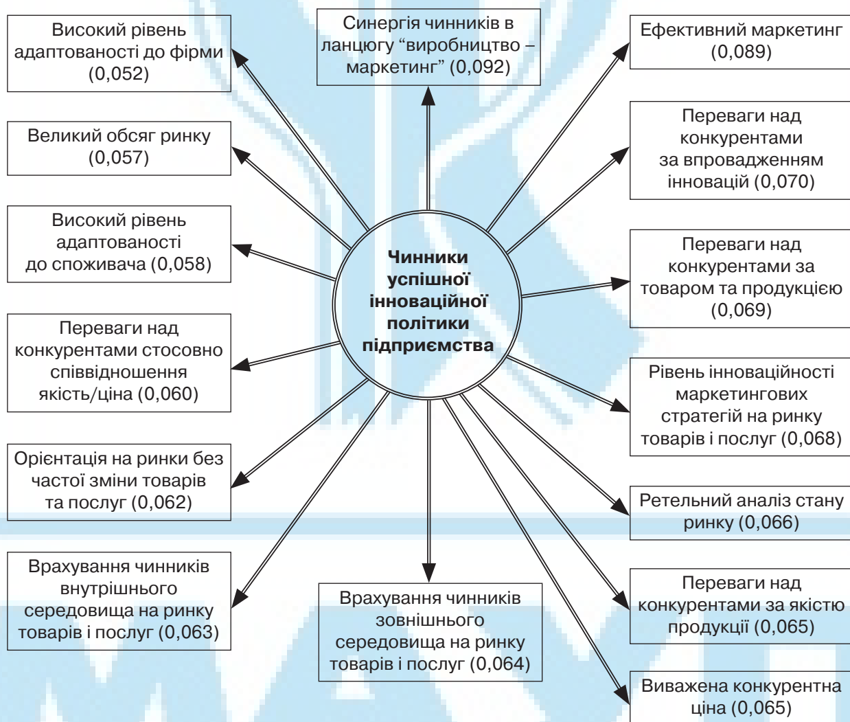
Рис. 2. Структура та вагомість чинників, які забезпечують успішність інноваційної політики економічного розвитку підприємства, відносні одиниці

Для забезпечення успішної інноваційної політики економічного розвитку підприємства нами визначено структуру та здійснено експертну оцінку вагомості 15-ти провідних чинників, які забезпечують її успішність (рис. 2).